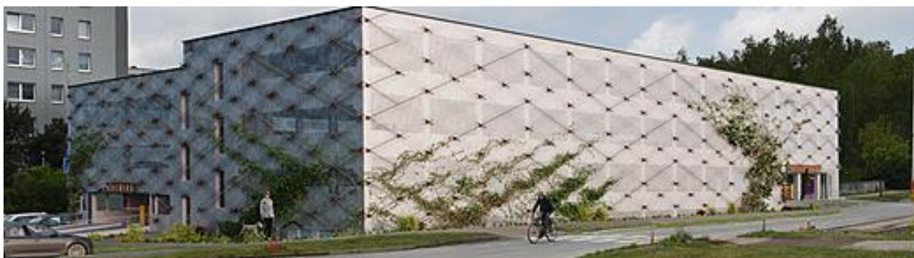
Obrázek - parkovací dům na Sídlišti nad Lužnicí

V úterý 8.října 2024 byla zahájena výstavba parkovacího domu na Sídlišti nad Lužnicí. Investorem jsou Technické služby Tábor. Zhotovitelem se v zadávacím řízení staly společnosti Metrostav DIZ a Památky Tábor s nejnižší nabídkovou cenou 82 milionů Kč bez DPH.